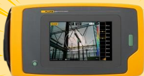
FLUKE : FLK-ii900