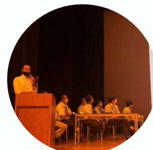
脱炭素化啓発セミナー (外部登壇)