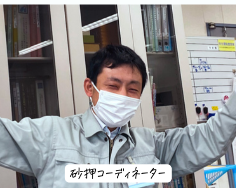
砂押コーディネーター

世界的に気候変動への対応が企業の価値を左右する重要な要素となり、サプライチェーン全体での脱炭素化の流れにより地域企業においても脱炭素化に向けた取組が求められます。脱炭素化事業は、脱炭素化に向けた情報の提供や省エネ・再エネ設備導入のアドバイス等を行い、企業の実現可能な取り組みを支援する事業です。