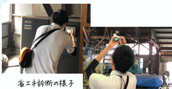
省エネ診断の様子