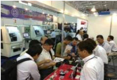
出展ブースの様子