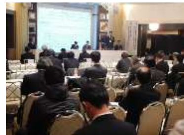
シンポジウム風景