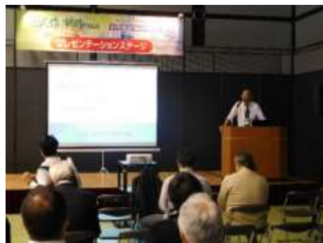
ワークショップ(企業紹介)の様子