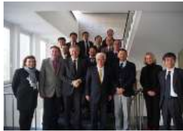
BW 州経済省表敬訪問