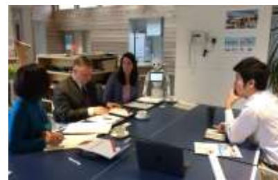
有力企業による企業訪問