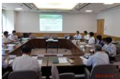
CAM 研究会風景 (8/30)