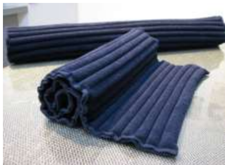
新規入居者の製品（枕）