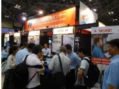
展示ブースの様子①