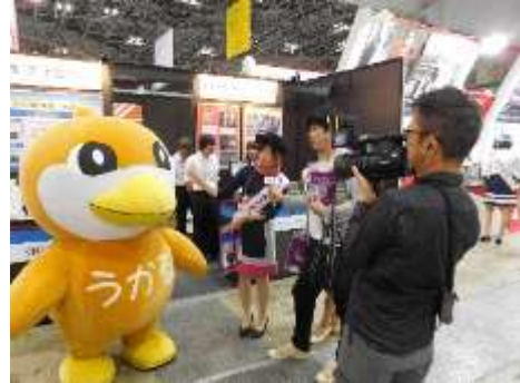
展示ブースの様子②