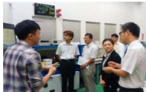
精密機械研究发展中心訪問②