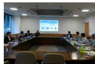
CAM 研究会風景 (12/6)