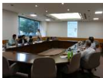
CAM 研究会風景 (10/5)